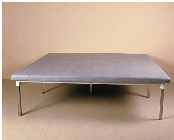
TABLE FIXE BOBATH TF1-3020 / TF1-3030

Par l'arrêté du 20 avril 2006 fixant les modalités d'application des procédures de certification de la conformité définies aux articles R. 5211-39 à R. 5211-52, pris en application de l'article R. 5211-53 du code de la santé publique.