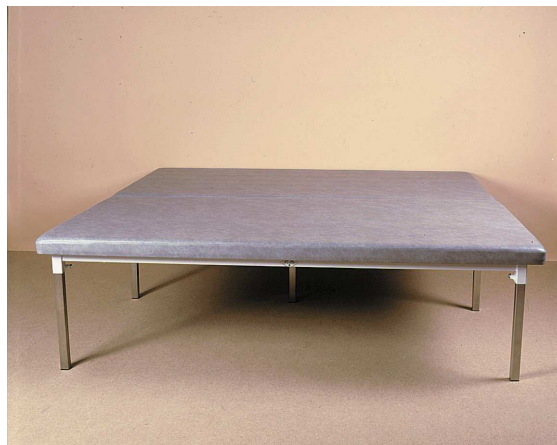
TABLE FIXE BOBATH TF1-3020 / TF1-3030

Par l'arrêté du 20 avril 2006 fixant les modalités d'application des procédures de certification de la conformité définies aux articles R. 5211-39 à R. 5211-52, pris en application de l'article R. 5211-53 du code de la santé publique.